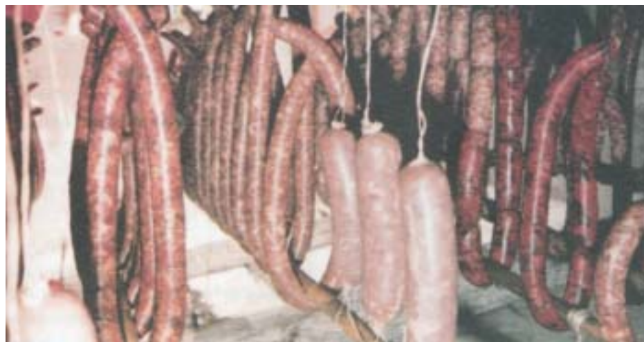
Vari tipi di Salsicce

Le materie prime sono: carne magra, fegato, cuore, polmone, grasso, sale, pepe, peperoncino e aglio. L'impasto di questo tipo di salsiccia viene fatto con una parte di carne magra di maiale, una parte di grasso morbido e una parte costituita da fegato di maiale, cuore, reni, polmone, parti della carcassa che presentano residui sangue, come ad esempio la zona della gola. Il tutto viene macinato con lamelle da dieci millimetri, conciato ed