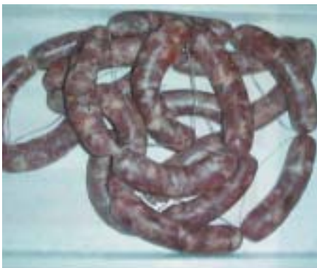
Salsiccia di Maiale