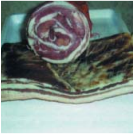
Ventresca tesa e arrotolata