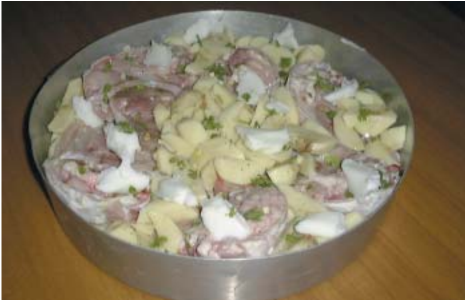
Testine di agnello