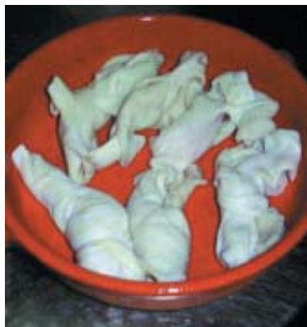
Nodi di trippa

Le materie prime sono: pezzi di trippa di agnello, aglio, prezzemolo, pomodoro,